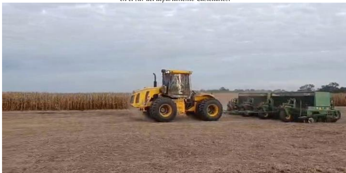
♦ Lote con rastrojo de soja tardía (de segunda), en pleno proceso de siembra de trigo, variedad ciclo intermedio, en el centro del departamento General Obligado.