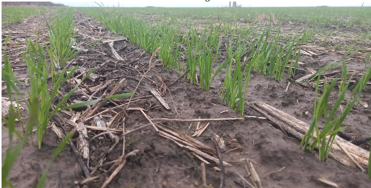
♦ Lote con trigo, con muy buena germinación - emergencia, variedad ciclo largo, en el sur del departamento Castellanos.