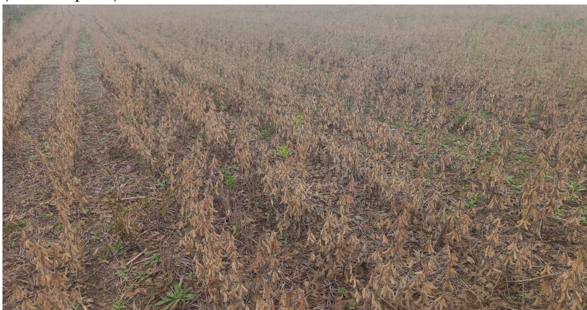
♦ Lote con soja tardía (de segunda); en R8 (madurez plena), buen estado, en el centro norte del departamento General Obligado.

Se observó la siguiente etapa fenológica: R “estados reproductivos”, en R8 (madurez plena).