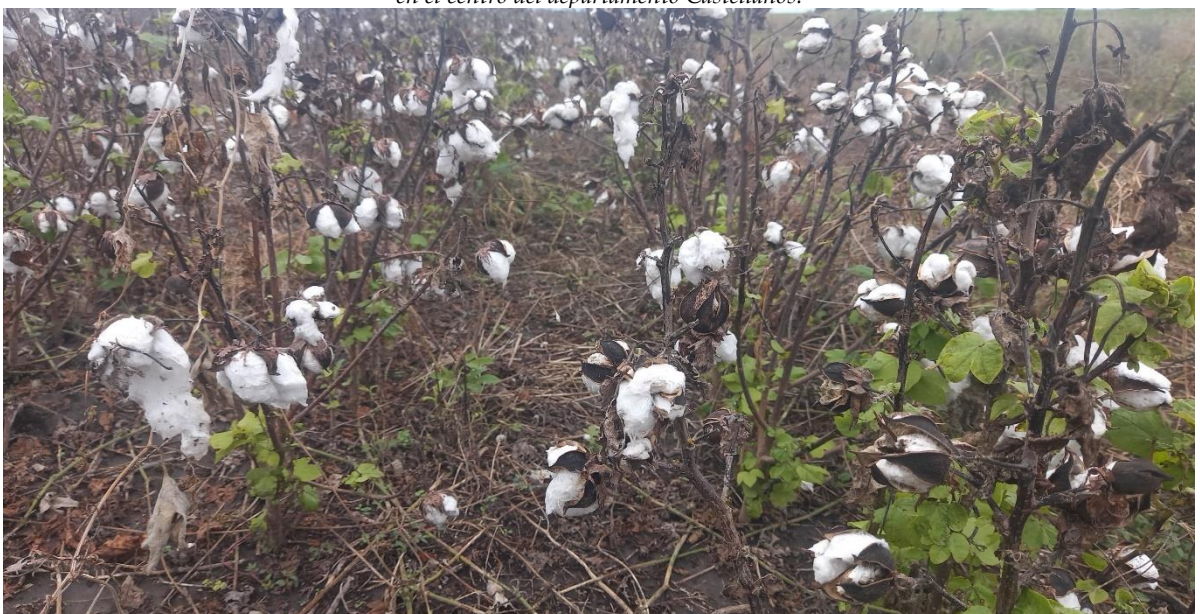
◆ Lote con algodón, en etapa de fin de maduración, buen estado, con rebrotes, en el centro norte del departamento General Obligado.