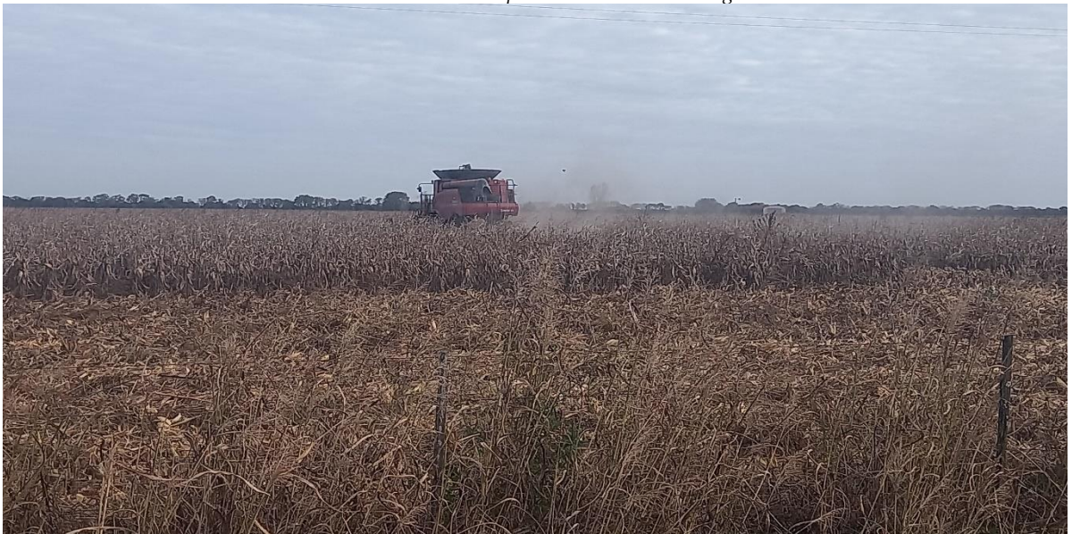
◆ Lote con maíz tardío, en pleno proceso de cosecha, uniforme, en el centro del departamento Castellanos.