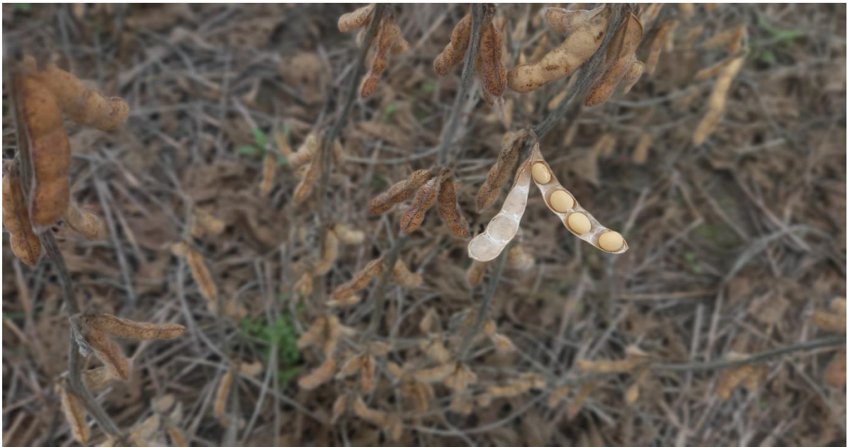
◆ Lote con soja tardía (de segunda), en R8 (madurez plena), buen estado, en el centro norte del departamento General Obligado.