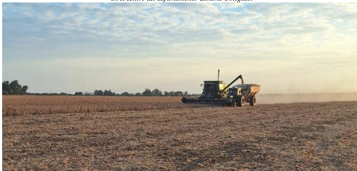
♦ Lote con soja tardía (de segunda), en pleno proceso de cosecha, buen estado, en el centro norte del departamento Nueve de Julio.