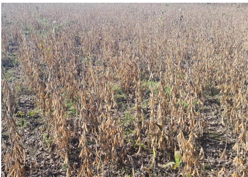
♦ Lote de soja temprana; en R8 (madurez plena), en el centro del departamento General Obligado. 2023