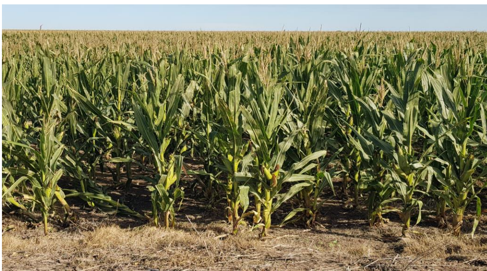
♦ Lote de maíz tardío ; en etapa de floración, en el sur oeste del departamento San Jerónimo.