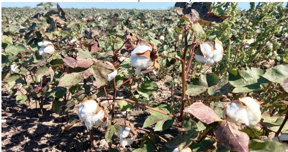
♦ Lote de algodón ; en etapa de madurez fisiológica, en el norte del departamento General Obligado.

Imágenes de la campaña 2023 de soja temprana, soja tardía en sus distintas etapas fenológicas, maíz tardío y algodón, en diferentes localizaciones geográficas y condiciones ambientales, en un nuevo período de siete días, en los departamentos que evalúa el SEA.