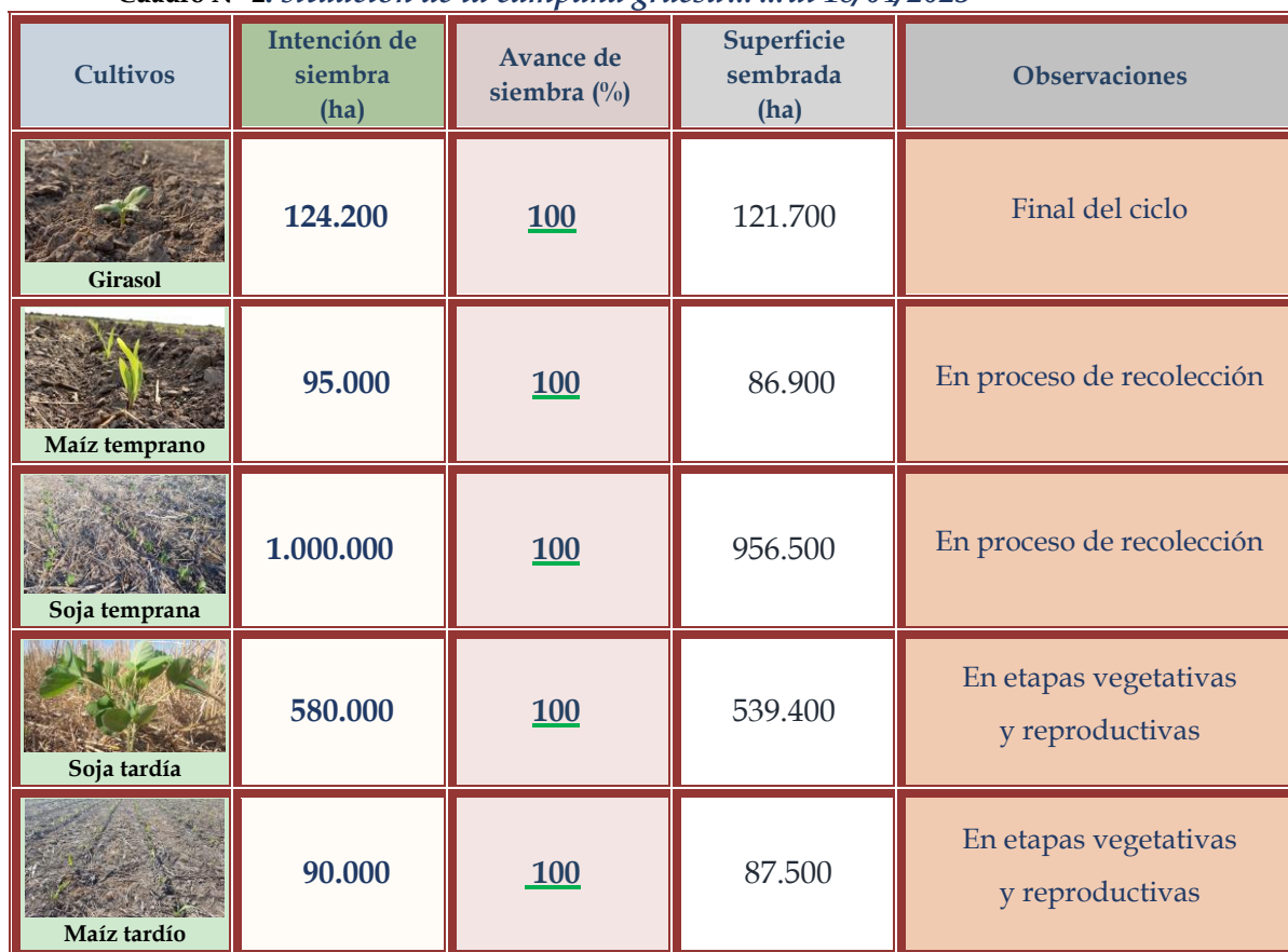
Cuadro N° 2: situación de la campaña gruesa... al 18/04/2023

===== Informantes que colaboran para la confección del presente informe: