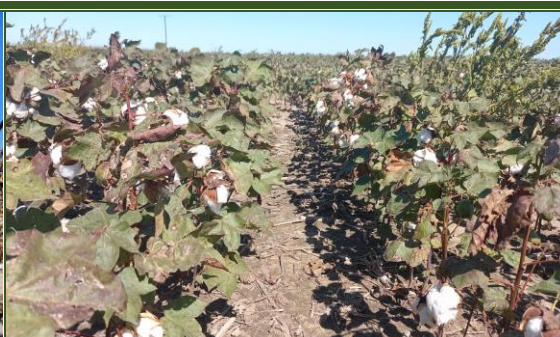
Lote de algodón; en maduración, con malezas, en el centro del departamento General Obligado .