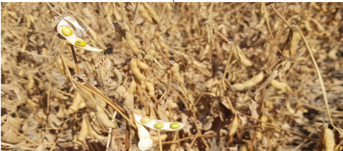
♦ Lote de soja temprana ; en estado fenológico R8 (madurez plena) y granos verdes, en el centro oeste del departamento Las Colonias.