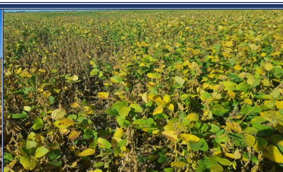
Lote de soja tardía; con muy buen estado y desarrollo, en el centro oeste del departamento Castellanos.