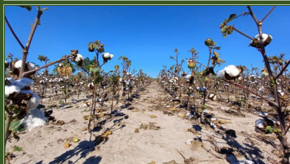
Lote de algodón; en maduración M2 (60 % de cápsulas viertas), uniforme, en el centro del departamento General Obligado .

cápsulas M “maduración”, M1 (1º cápsulas abiertas), M2 (60 % de cápsulas abiertas) y los más avanzados, en madurez fisiológica.