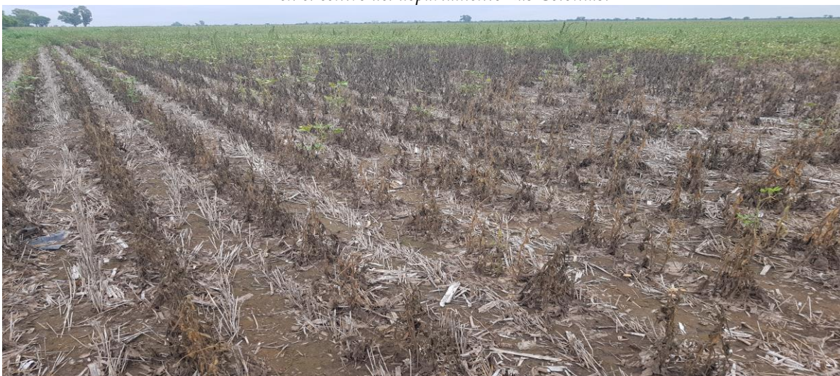
♦ Lote de soja tardía ; afectado por déficit hídrico y alguna reacción luego de las precipitaciones, en el oeste del departamento Castellanos.