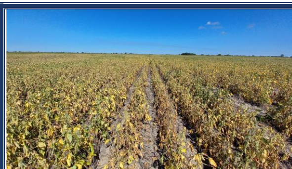
Lote de soja tardía; con buen desarrollo de plantas, uniforme, en el centro norte del departamento General Obligado.

Se observaron los siguientes estados fenológicos: V “estados vegetativos”, R1 (inicio de floración), R2 (floración con uno de los nudos superiores con hojas desarrolladas), R3 (vaina de 5 mm de longitud en nudo), R4 (vaina de 20 mm de longitud en nudo), R5 (comienzo de llenado de semilla en nudo), R6-1 (semilla verde de tamaño máximo del nudo) y los más avanzados, en R7 (comienzo de madurez, una vaina con color de madurez).