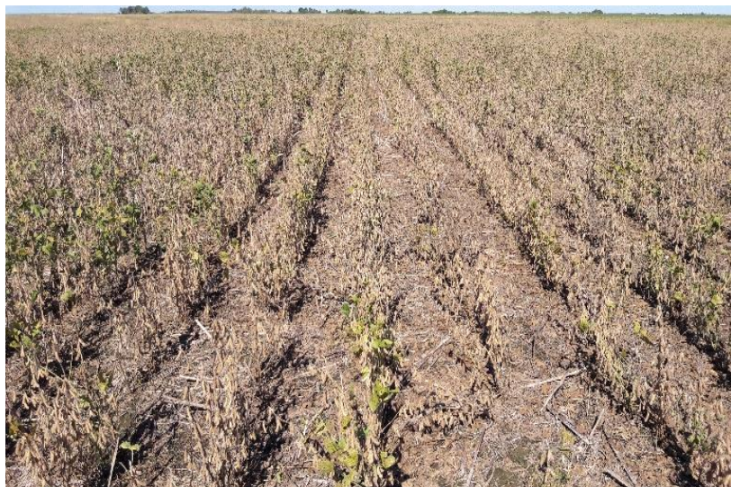
♦ Lote de soja temprana ; en R8 (madurez plena), en el centro del departamento General Obligado .

Como ejemplo, imágenes comparativas del cultivo de soja temprana en un mismo sitio geográfico entre períodos iguales, de la campaña pasada y la presente.