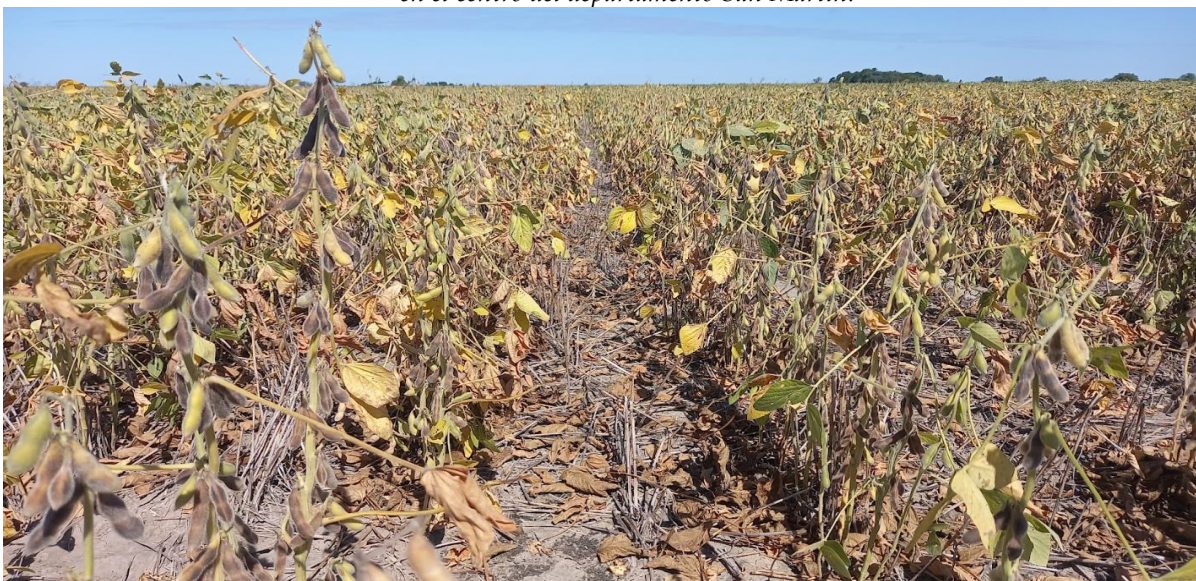
♦ Lote de soja tardía ; en estado fenológico, R7 (comienzo de madurez), en el centro del departamento Las Colonias.