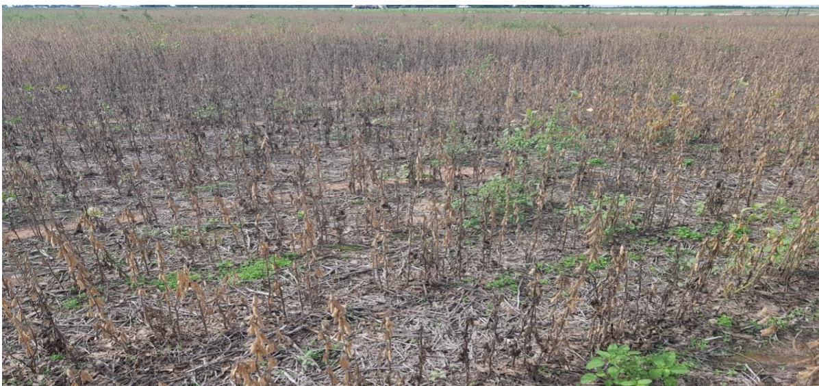
♦ Lote de soja tardía ; muy afectado por el déficit hídrico, en el centro del departamento San Martín.