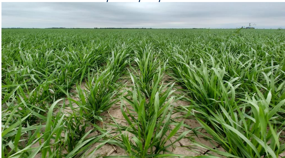
♦ Lote con trigo ; en estado muy bueno, en el centro norte del departamento General Obligado.

" Trigo en estado bueno a muy bueno, a la espera de precipitaciones "