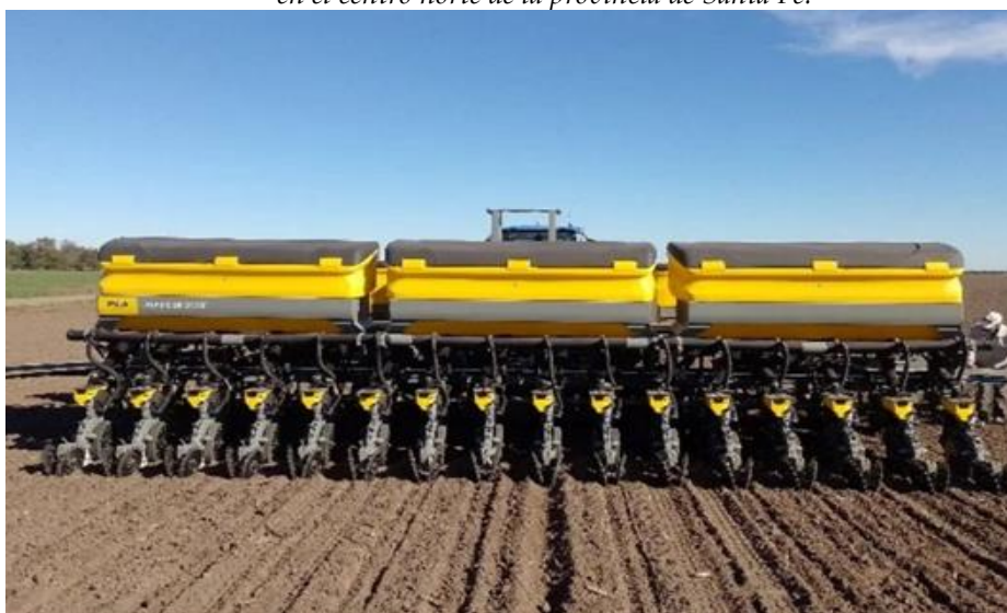
♦ Lote roturado ; en pleno proceso de siembra de girasol, en el centro del departamento General Obligado.