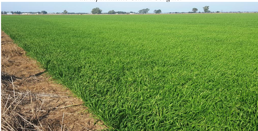
♦ Lote con trigo ; en estado muy bueno, en el centro del departamento Castellanos.