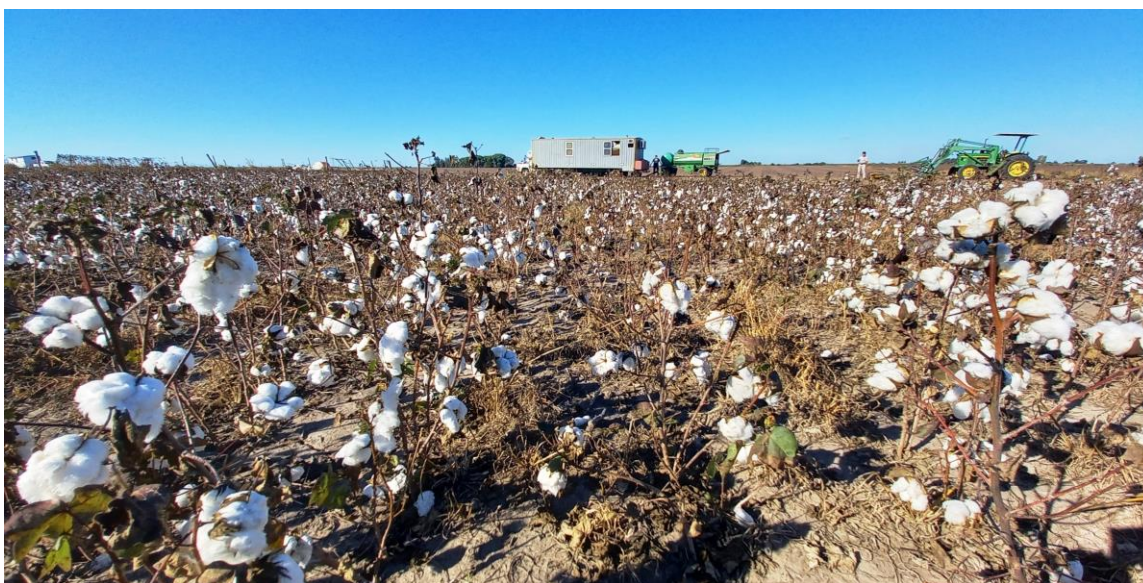
♦ Lote con algodón ; en pleno proceso de cosecha, en el noroeste del departamento Nueve de Julio.