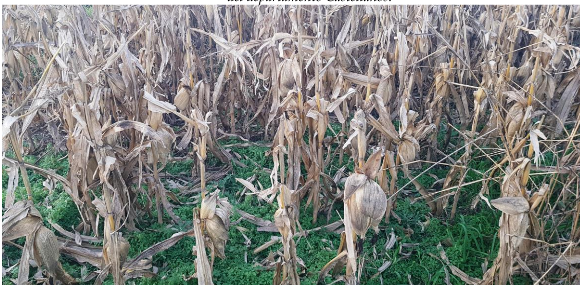
♦ Lote con maíz tardío ; en etapa de maduración fisiológica, a la espera de su cosecha, en el centro sur del departamento Las Colonias.