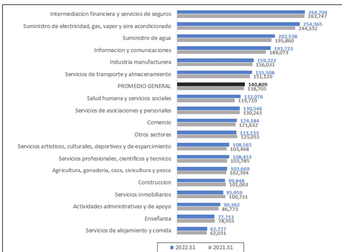
Gráfico 2: Salario real promedio por ramas de actividad. Primer semestre de 2022 (2022.S1) y 2021 (2021.S1) 6 . Provincia de Santa Fe.

Fuente: CES-BCSF en base a datos del Ministerio de Desarrollo Productivo de la Nación.